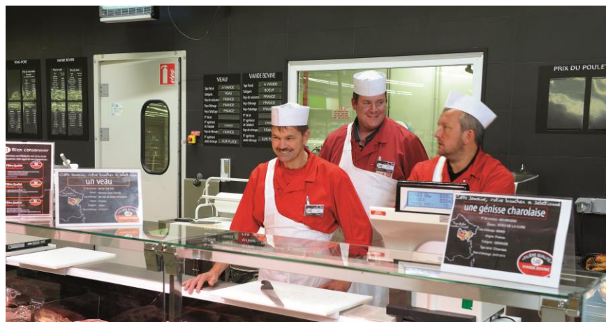
Notre équipe Boucherie